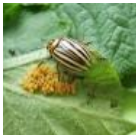
Volwassen Coloradokever met eitjes

In België en Nederland is het direct bestrijden van de coloradokevers voor zowel landbouwers als particulieren wettelijk verplicht !